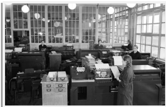
Машинносчетная станция 1959г.

Итоги переписи по Кемеровской области, которая теперь уже имела статус самостоятельного субъекта страны, за двадцатилетний межпереписной период показали рост численности населения с 1,7 млн. человек до 2,8 млн. человек. Доля городского населения увеличилась и достигла 77%. Война принесла с собой не только большие людские потери, но и репрессии, эвакуацию. Эти обстоятельства значительно повлияли на численность и состав населения Кузбасса.