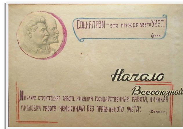
Отчет Прокопьевской городской инспектуры Нархозучета Новосибирской области о проведении Всесоюзной переписи населения

По итогам переписи 1939г. Россия еще оставалась «сельской» страной (доля сельского населения составляла 66,5%). «Городской» она станет по итогам следующей переписи. Кузбасс же был «городским» уже тогда (доля городского населения составляла 55%).