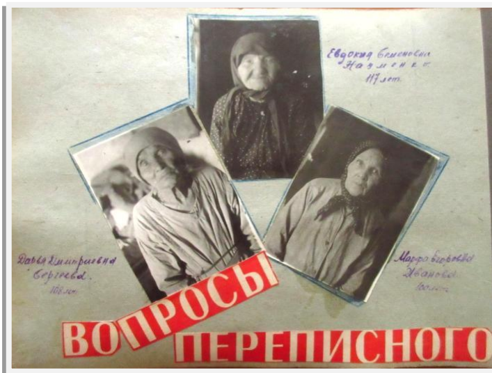
Страница Отчета, посвященная долгожителям

Содержание Отчета демонстрирует всю ответственность и креативность, с которой работники на местах относились к своим обязанностям по организации и проведению переписи. Такое отношение к переписной работе было характерно для всей страны. В Отчете представлено много фотографий, рассказывающих о проделанной «политико-массово-разъяснительной работе» среди разных групп населения: на предприятиях, в учреждениях, домах культуры.